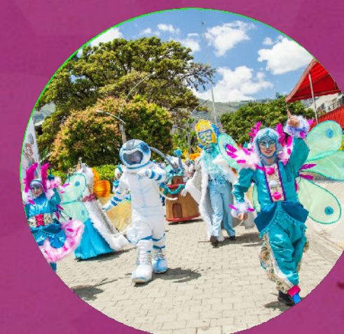
Zona que Suena