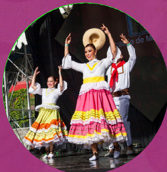
Calles de los Artistas

Noche Afro: Agosto 4 Noche Colombiana: Agosto 5. Noche Tropical: Agosto 6. Noche de homenaje a Fruko: Agosto 7 Noche de Son y Bolero: Agosto 8.