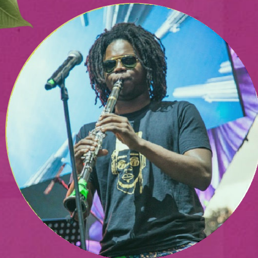
Concierto inaugural El Obelisco Agosto 2

*Se realizan con empresa patrocinadora: aliados estratégicos FLA y Bavaria.