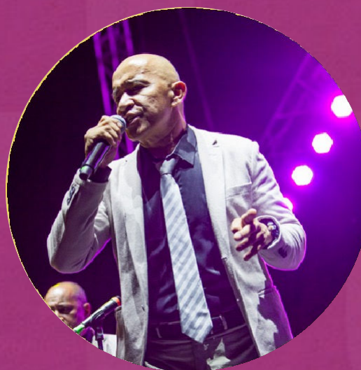
Escenarios Artísticos (tablados)*

Plazas de Flores: Agosto 2 al 11 Parque Lleras: Agosto 3 Junín: Agosto 3 Pueblito Paisa: Agosto 7 Carrera 70: Agosto 10 Plaza Botero: Agosto 10