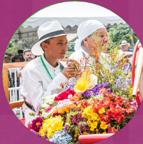
Plazas de las Flores: lo mejor de nuestras tradiciones en un mismo lugar

Parque Norte: Agosto 2 al 6 Ciudad del Río Agosto 7 al 11 Aeroparque Juan Pablo II: Agosto 7 al 11