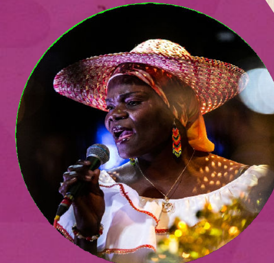
Parque Cultural Nocturno en Plaza Gardel

Parque Norte: Agosto 2 al 6 Ciudad del Río Agosto 7 al 11 Aeroparque Juan Pablo II: Agosto 7 al 11